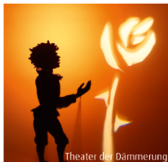
Theater der Dämmerung